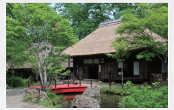
会場：平家の里 観覧時間 / 8:30～17:00