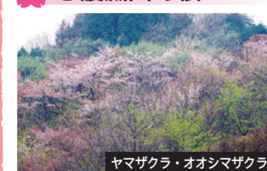
ヤマザクラ・オオシマザクラ