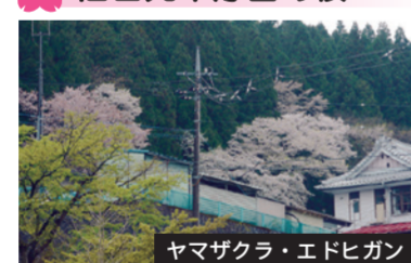
ヤマザクラ・エドヒガン