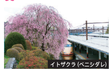
イトザクラ(ベニシダレ)