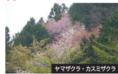
ヤマザクラ・カスミザクラ