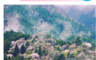
ヤマザクラ・オオヤマザクラ・カスミザクラ