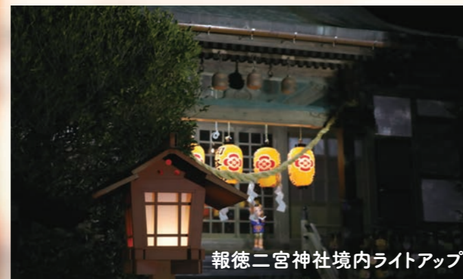
報徳二宮神社境内ライトアップ