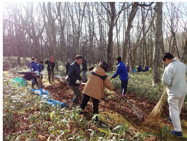
熊手や竹箒で落ち葉を集めます