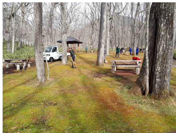
たくさん作業してきれいになりました！