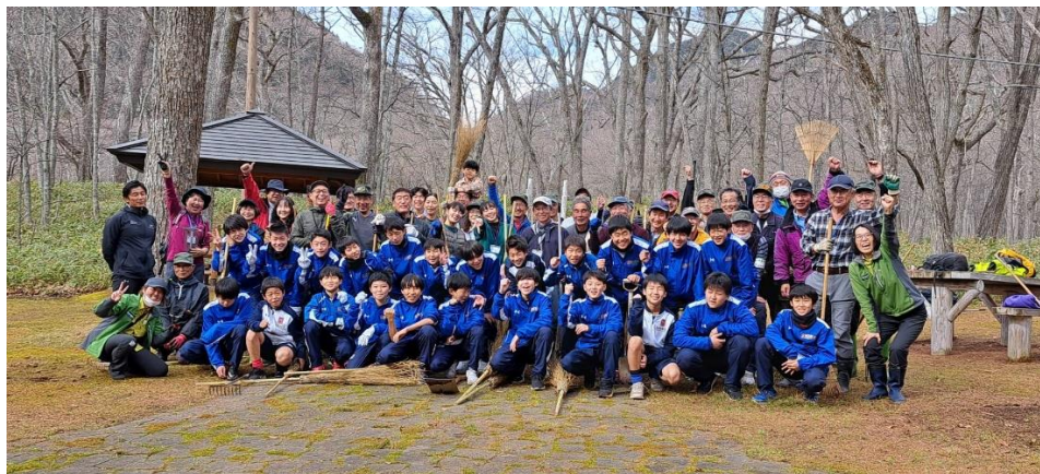
最後にみんなで記念写真！