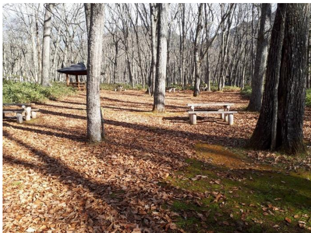
園地内には落ち葉がたくさん落ちていました

この日の参加者は34名、さらに地域のスポーツ少年団のみなさまが参加してくださり、総勢60名ほどでの活動になりました。光徳園地に降り積もった落ち葉や枝を集め、車椅子でも利用できるバリアフリーな園地を保つために清掃を行いました。