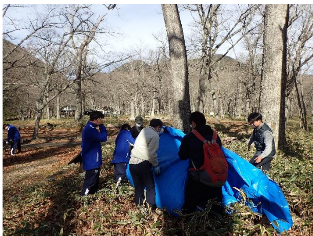
集めた落ち葉をブルーシートで運びます