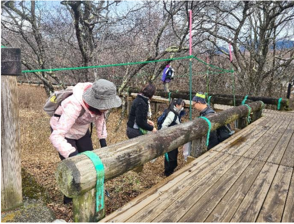
展望台付近には侵入防止のポールロープを設置