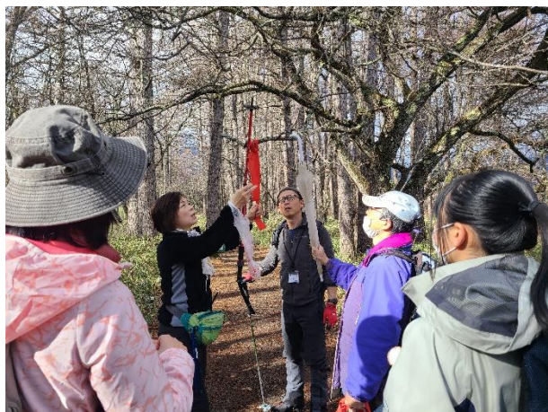
初めて参加する人には先輩が教えます