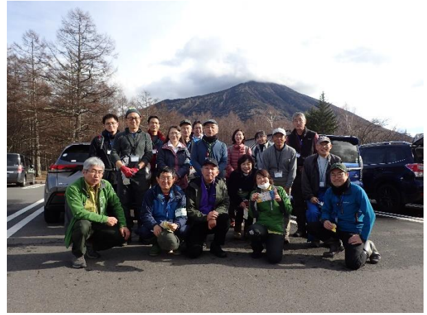
最後にみんなで記念撮影！