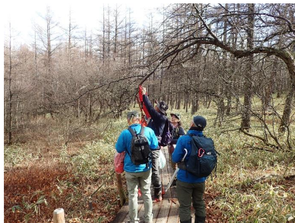
目立つ場所に赤布を取り付け