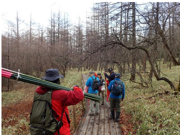
道具を持って木道を進みます

この日の参加者は17名。雪が本格的に降る前に、戦場ヶ原の歩道沿いに赤布を取り付けたり展望台にポールを立てたりして、降雪期の安全利用のための準備を行いました。