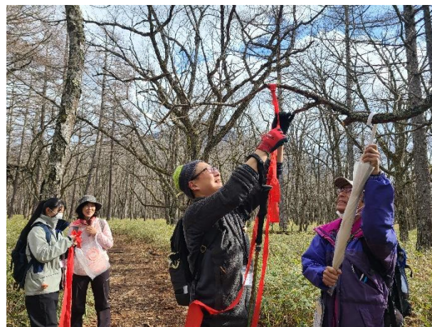
取り付け方をみんなで覚えました