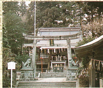
⑦ 頭龍山 瑞光寺 栃木県日光市平ヶ崎374 ☎ (0288) 21-1623