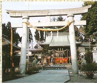
③ 星願山 如来寺 栃木県日光市東郷町710 ☎ (0288) 21-0105