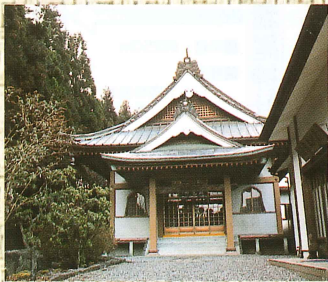
⑥ 虚空山 徳性院 栃木県日光市平ヶ崎230-2 ☎ (0288) 21-0429