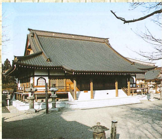
② 長性山 本敬寺 栃木県日光市大谷向1430-15 ☎ (0288) 21-1566