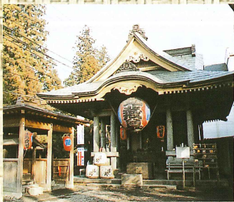
④ 報徳二宮神社 栃木県日光市今市743 ☎ (0288) 21-0138