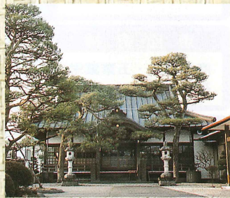
⑤ 追分 地藏尊 栃木県日光市小倉町117 ☎ (0288) 22-4804