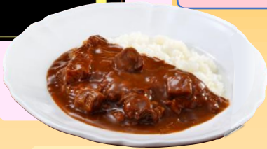
表紙掲載商品につきましては裏面をご覧ください。