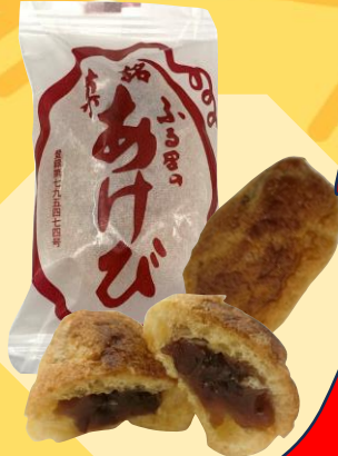
※各お土産店で販売中