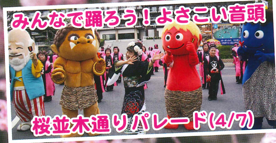
みんなで踊ろう!よさこい音頭