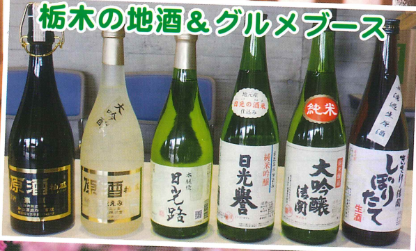
栃木の地酒&グルメブース