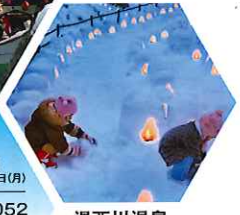
湯西川温泉 かまくら祭 【湯西川・川俣・奥鬼怒エリア】 平成25年1月26日(土)～3月17日(日) お問い合わせ先 TEL.0288-97-1126