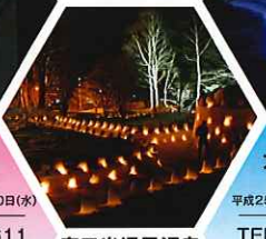
奥日光湯元温泉 雪まつり 【日光・奥日光エリア】 平成24年12月1日(土)～平成25年3月31日(日) お問い合わせ先 TEL.0288-54-2496