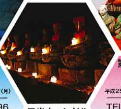
日光キャンドル ページェント 【日光・奥日光エリア】 平成25年2月8日(金)～2月12日(火) お問い合わせ先 TEL.0288-54-2496