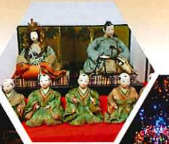
第8回日光鉢石宿の おひなさま 【日光・奥日光エリア】 平成25年2月11日(月)～3月3日(日) お問い合わせ先 TEL.0288-54-2496