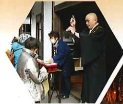
今市宿 七福神めぐり 【今市エリア】 平成25年2月13日(水)～2月20日(水) お問い合わせ先 TEL.0288-21-5611