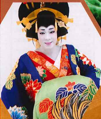
梅沢富美男劇団 特別公演 平成25年2月9日(土)・10日(日)