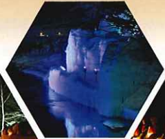
中禅寺温泉 カマクラまつり 【日光・奥日光エリア】 平成25年2月9日(土)～2月11日(月) お問い合わせ先 TEL.0288-54-2496