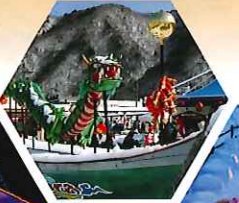
第7回 春節祭 【鬼怒川・川治エリア】 平成25年2月9日(土)～2月11日(月) お問い合わせ先 TEL.0288-77-2052