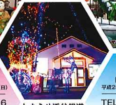
わたらせ渓谷鉄道 各駅イルミネーション 【日光・奥日光エリア】 平成24年12月1日(土)～平成25年2月28日(木) お問い合わせ先 TEL.0288-54-2496